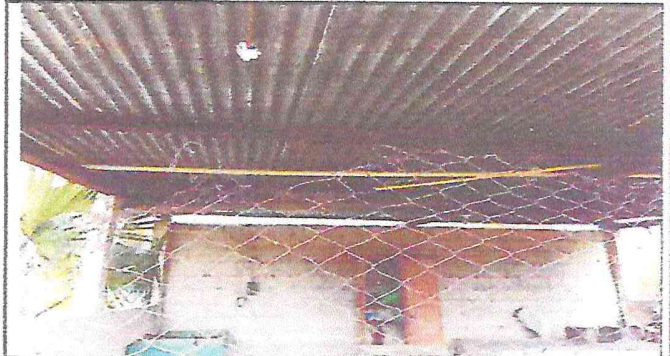
Foto 2: Mantenimiento de estructura de soporte de metal de modulo 1,2,3,4,5 y 6